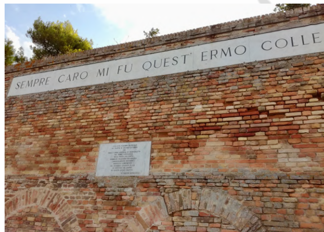
Il Colle dell'Infinito

Francesco De Sanctis, Saggi critici, 1858