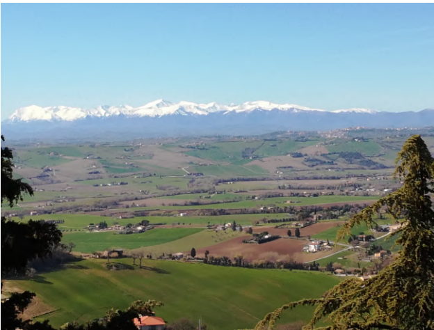
La catena dei Monti Sibillini, “i monti azzurri”.

Per i gruppi che lo desiderassero è possibile organizzare spuntini e assaggi di prodotti tipici.