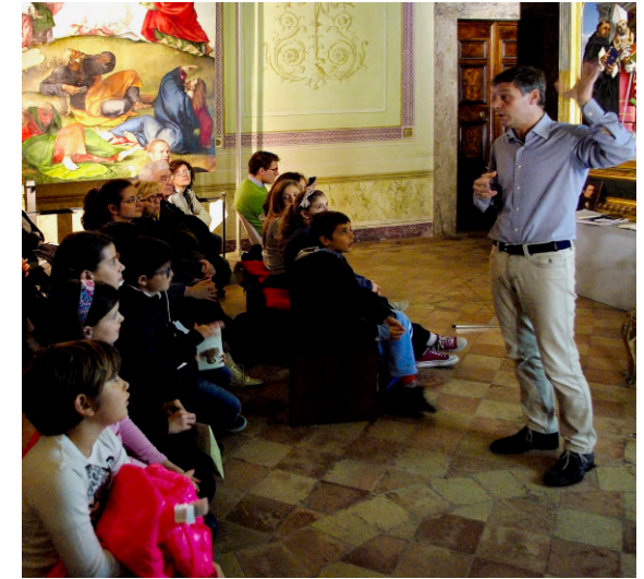
Leopardi spiegato ai bambini